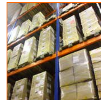
STOCK CUVES ET VASQUES