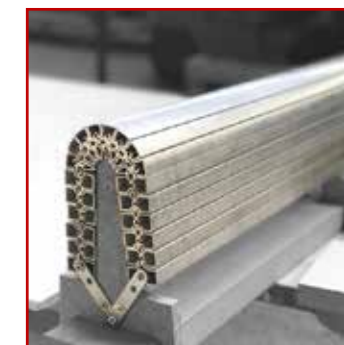
MATERIEL DE THERMOFORMAGE