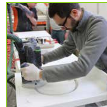
OUTILS PROFESSIONNELS À DISPOSITION