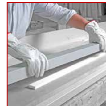
SYSTEME DE SERRAGE