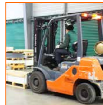
PRÉPARATION ET LIVRAISON RAPIDES