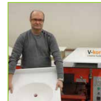
EMPORTEZ VOS RÉALISATIONS